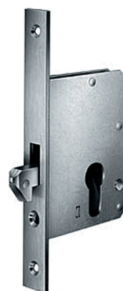
Hákový zámek 1112